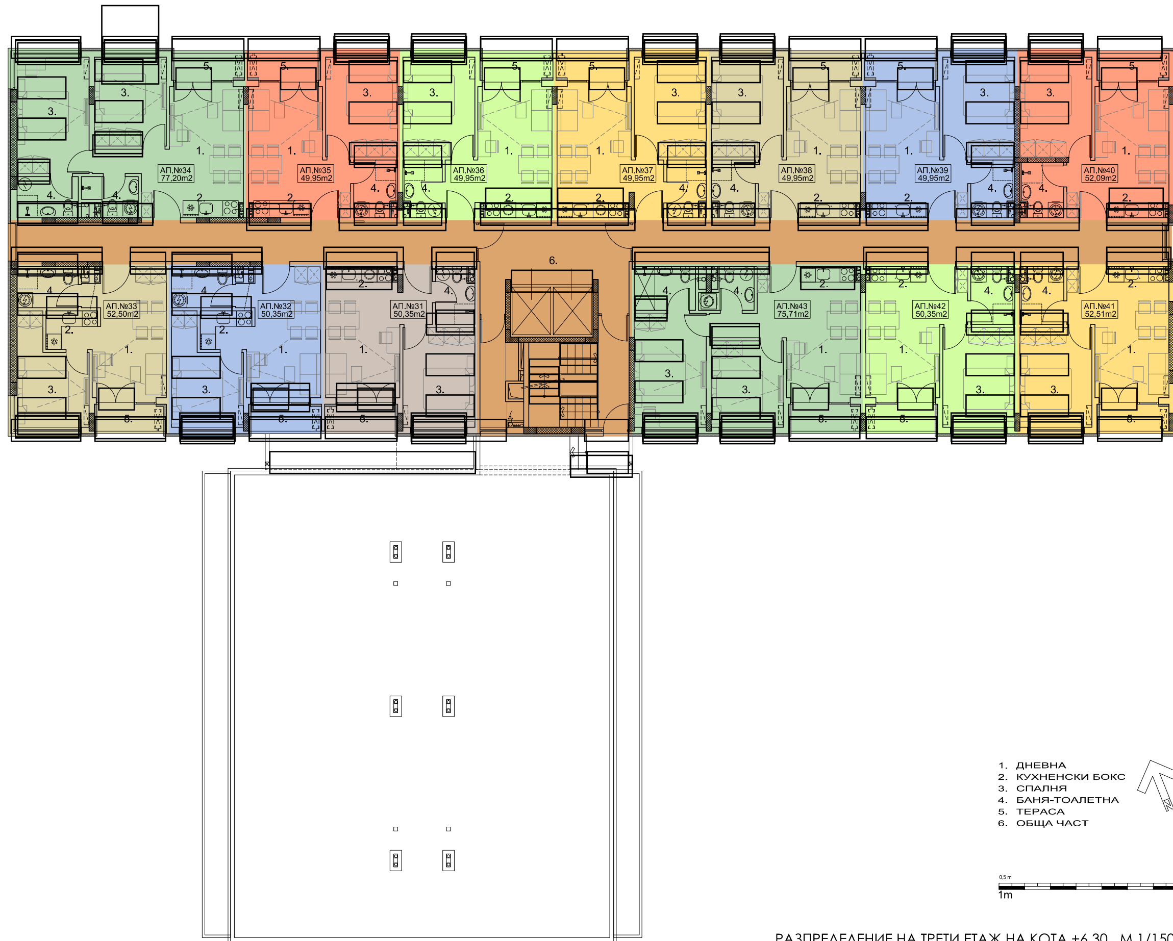
РАЗПРЕДЕЛЕНИЕ НА ТРЕТИ ЕТАЖ НА КОТА +6,30 М 1/150