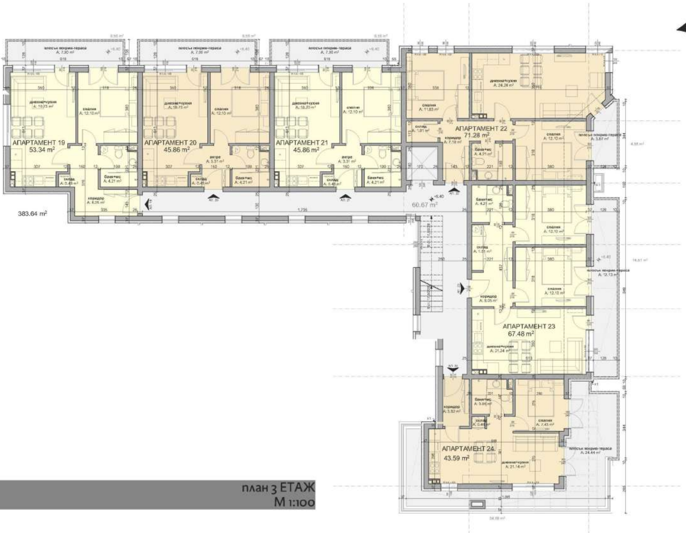
план 3 ЭТАЖ М 1:100